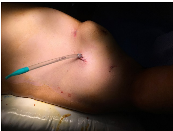
Figure 1 : Position opératoire.

Position opératoire : La procédure est réalisée sous anesthésie générale en utilisant une intubation endotrachéale à double lumière et une ventilation unilatérale pulmonaire controlatérale. Le patient est placé en décubitus dorsal avec une rétroversion de 30 degrés. Le bras homolatéral est placé sur la tête du patient dans un support (Figure 1).