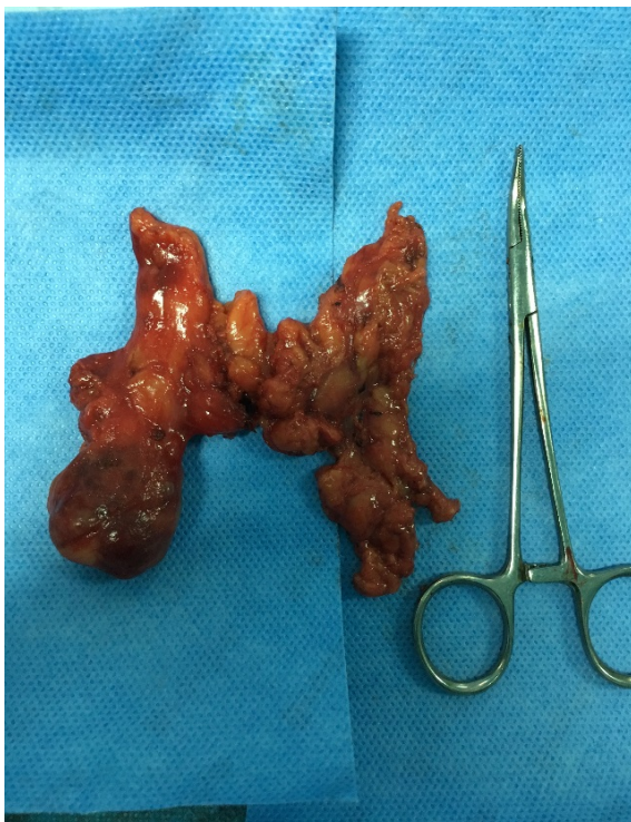
Figure 4 : Pièce opératoire.

Du côté droit les étapes opératoires restent similaires que celles décrites du côté gauche. Après élargissement de l'un des orifices de trocars, la pièce opératoire est par la suite placée dans un sac (Endobag) et retirée de la cavité thoracique (figure 4).