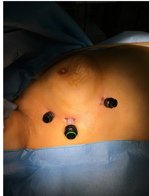
Figure 2 : Placement des trocarts.

la ligne axillaire moyenne au niveau du 5eme espace intercostal (EIC), où on introduit une caméra. Après une exploration endothoracique, mise en place et sous contrôle de la caméra du deuxième trocart (5 mm) au niveau de la ligne axillaire antérieure et au niveau du 3eme EIC, et après le 3eme trocart (5 mm) et mis au niveau du 6eme ou 7eme EIC sur la ligne medio-claviculaire (Figure 2).