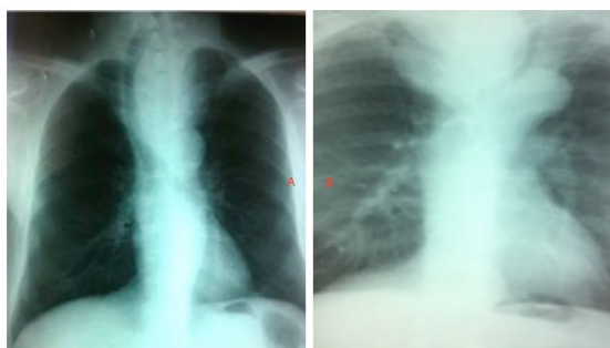
Figures 2 : Radiographies thoraciques de face montrant : a/ une importante déviation trachéale à droite. b/ une déviation trachéale avec sténose.

Une laryngoscopie indirecte a été réalisée chez deux patients, qui présentaient une dyspnée avec dysphonie, elle n'avait pas objectivé d'anomalies. Tous les malades avaient bénéficié d'une radiographie cervico-thoracique ainsi qu'un scanner cervico-thoracique injecté. En effet, une déviation trachéale a été retrouvée chez 15, (93%) de nos patients, à des degrés divers (Figure 2 a), une sténose trachéale radiologique était objectivée chez 3, (18%) de nos patients (Figure 2b).