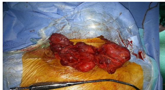
Figure 4 : Accouchement d'un volumineux goitre plongeant.

fibroscope par les oto-rhino-laryngologues a mis en évidence une paralysie récurrentielle unilatérale pour la première patiente et bilatérale pour la deuxième. La récupération pour les deux patientes était progressivement favorable avec fermeture des orifices des trachéotomies. Un seul cas de saignement per opératoire (plaie de la veine thyroïdienne inférieure lors de l'accouchement d'un goitre) ayant nécessité une transfusion a été déploré (Figure 4).