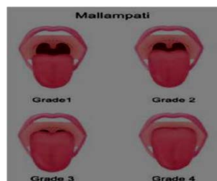
Figure 1: score de Mallampati

L'évaluation du Mallampathi permet d'identifier les patients à risque de présenter des difficultés à l'intubation (Figure 1).